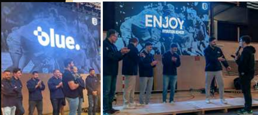
LOGO ÉCRAN GÉANT BODEGA

Pour une présence visible lors des temps forts réceptifs et des activations partenaires.