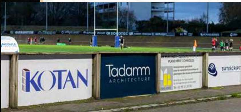
PANNEAU FIXE 1,5 X 1 M

Pour gagner en visibilité autour du terrain et dans l'environnement match.